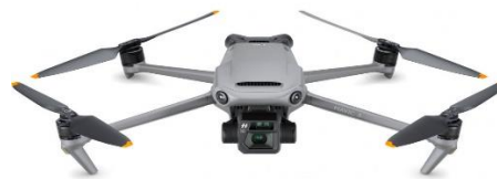
Рисунок 3 – БПЛА DJI Mavic 3

Також зараз використовують громадські БПЛА для роботи в бойових умовах. Цільово-транспортні платформи по суті є спадкоємцями розвитку розвідувальних безпілотників [7].