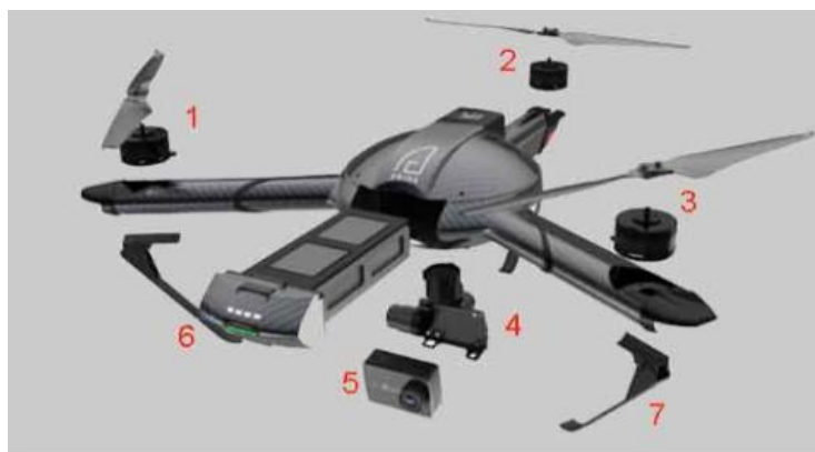
Рисунок 4 – Конструкція БПЛА у залежності від типу має різні елементи 1,2,3 – силові двигуни та гвинти; 4 – карданний підвіс; 5 – активна камера; 6 – відсік з батареєю живлення; 7 – лапа

За політ безпілотника відповідають двигуни, регулятори та пропелери. За допомогою регулятора встановлюється швидкість. Акумулятор є джерелом енергії для двигунів та інших компонентів БПЛА. Комерційні та побутові безпілотники управляються за допомогою пультів дистанційного керування. Управління військовими частинами здійснюється за допомогою дистанційного керування та супутникових систем [8].