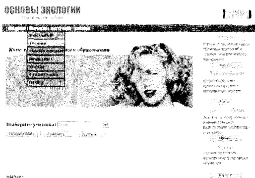
Рис. 2. Внешний вид главного меню

После загрузки программы пользователь попадает в главное окно, из которого он может открывать тексты лекций, проходить тестирующие задания для контроля знаний, выполнять практические задания, а также лабораторные работы.