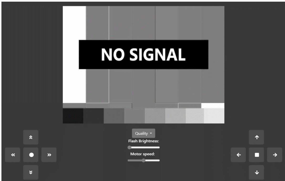
Рисунок 1 – Вигляд веб-інтерфейсу роботизованої платформи відеонагляду

За наведеними вимогами до веб-інтерфейсу робота було створено веб-сторінку з використанням HTML та CSS, яку наведено на рисунку 1.