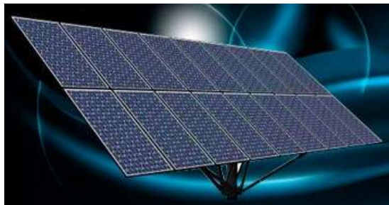
Рис.2. Монокристалічна сонячна батарея

Недоліком монокристалічних панелей є їх ціна, що обумовлено складністю їх виробництва. Крім того, для досягнення максимальної продуктивності панелей необхідно контролювати їхню орієнтацію щодо сонця, що передбачає встановлення додаткового обладнання.