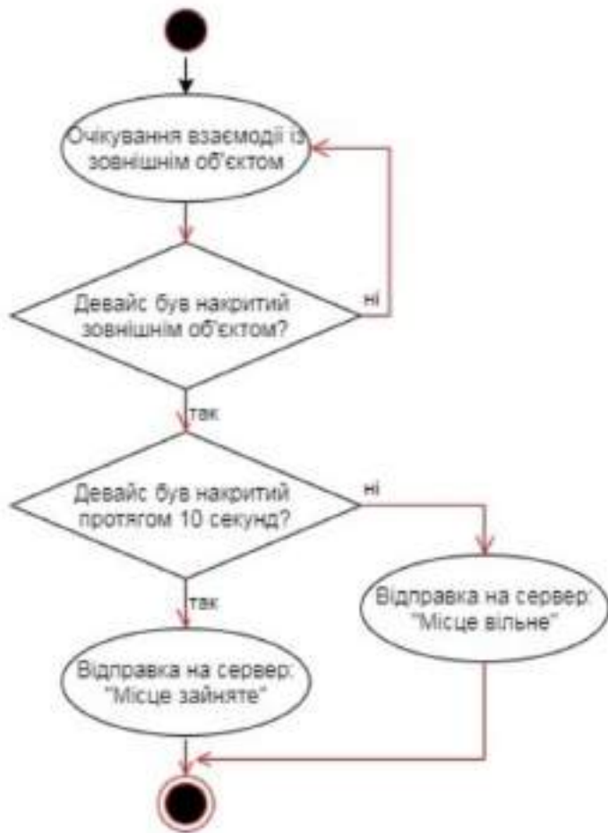
Рис. 1. Діаграма діяльності смарт-девайсу для сервісів

В середньому, для того, щоб автомобіль проїхав повз датчик з мінімальною швидкістю в 5 кілометрів за годину, йому необхідно витратити 10 секунд. Саме тому, для того, щоб захистити водія від неправильної інформації, датчик починає виконувати свої функції тільки через цей проміжок часу після того, як він був перекритий автомобілем і за умови, що протягом усього цього часу датчик був перекритий.