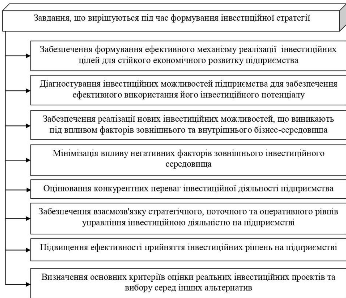
Рисунок 1 – Завдання, що вирішуються під час формування інвестиційної стратегії

Під час формування інвестиційної стратегії підприємства має бути вирішено ряд завдань, які представлено на рис. 1.