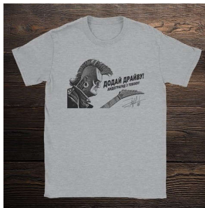
Рисунок 2 – Друк qr-коду на одягу

Також існує сфера B2B, де люди використовують дані qr-коди для того щоб зацікавлені партнери могли отримати телефони для самої установки контакту. Можна налаштувати qr-код, щоб набрати номер на телефоні одержувача безпосередньо. Користувачі можуть отримувати різні повідомлення від компанії після сканування коду. Цю саму функцію можна задіяти в SMS-маркетингу для різних продаж. Можливі оновлення продукту за запитом та підтримки користувачів. Qr-коди можливо використовувати для відправок електронних листів в рамках e-mail маркетингу та подальшого відстеження показників продуктивності (рис. 3).