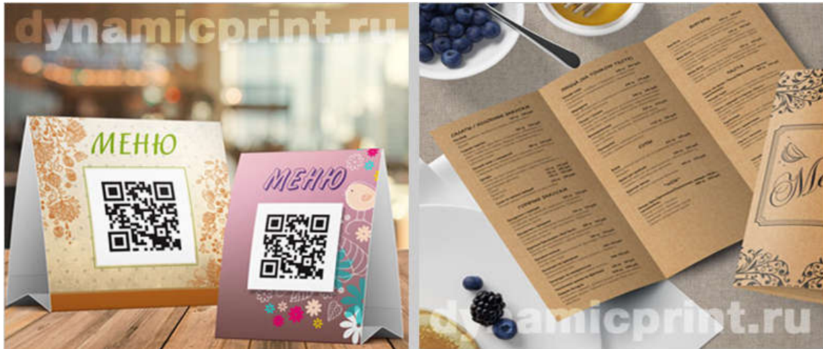
Рисунок 1 – Друк одноразових меню та меню с qr-кодами