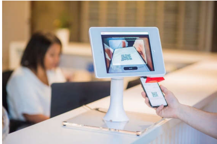
Рисунок 3 – Сканування коду для повідомлення