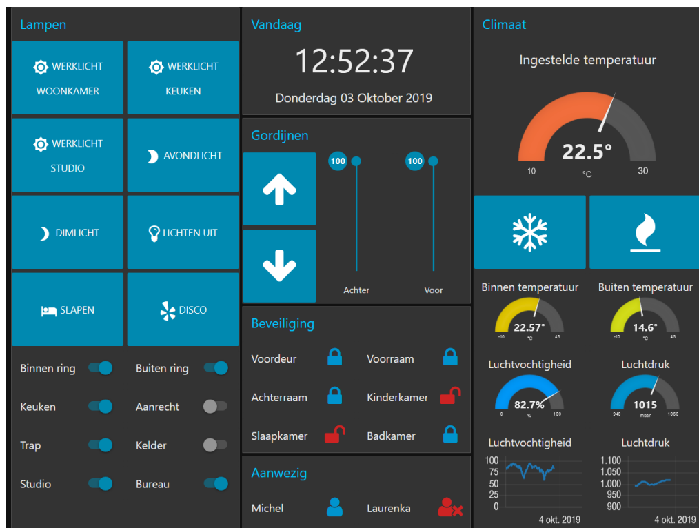
Рисунок 2 – Вигляд програми реалізованої у середовищі Node-RED

Однією з ключових переваг Node-RED є наявність інструментів для попередньої візуалізації даних. За допомогою панелі Dashboard користувач може створювати графіки, індикатори, таблиці, текстові віджети та інші елементи, які дозволяють швидко оглядати стан технологічного процесу (рис. 2). Хоча можливості Dashboard не можна порівняти з професійними аналітичними системами, він ефективно виконує роль оперативного моніторингу, особливо на етапі прототипування або роботи з невеликими проєктами. Гнучкість Node-RED полягає також у можливості встановлення додаткових модулів, що розширюють функціонал, зокрема компонентів для інтеграції з базами даних, штучним інтелектом або сервісами хмарної аналітики.