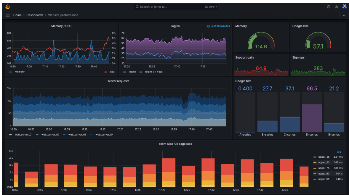
Рисунок 3 – Вигляд програми реалізованої у середовищі Grafana

Серед переваг Grafana варто виділити її здатність працювати з великими обсягами історичних даних, які можуть накопичуватися протягом тривалого часу. Користувач отримує можливість проводити порівняльний аналіз, відстежувати тенденції, аналізувати пікові навантаження та оцінювати ефективність роботи обладнання у різні періоди. Панелі можуть бути інтерактивними, що дає змогу змінювати інтервали аналізу, використовувати фільтри та переглядати окремі параметри без оновлення всієї сторінки (рис. 3). Це особливо корисно у промислових системах, де оператору необхідно швидко реагувати на зміни та оцінювати ситуацію за різними показниками [4].