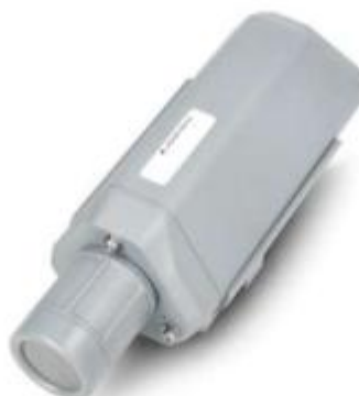
Рисунок 2 – Датчик SenseCAP S2103 з підтримкою LoRaWAN

Інше рішення — SenseCAP S2103 — побудоване на основі бездротової технології LoRaWAN, що дозволяє здійснювати передачу даних на великі відстані з мінімальним енергоспоживанням. Пристрій має захист корпусу IP66 і може працювати автономно до десяти років, однак для його використання необхідна розвинена мережа шлюзів і серверів LoRaWAN, що підвищує складність і вартість впровадження.