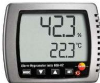
Рисунок 1 – Термогігрометр Testo 608-H2

H1/H2, який забезпечує вимірювання температури та вологості з високою точністю та надійністю. Ці прилади прості у використанні, проте не мають можливості передачі даних на комп'ютер або сервер, а також не зберігають історію вимірювань, що обмежує їх застосування у виробничих системах.