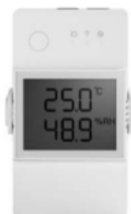
Рисунок 3 – Розумний перемикач SONOFF TH Elite з LCD-дисплеєм

Порівняльний аналіз цих систем свідчить, що наявні рішення здебільшого орієнтовані або на побутове використання, або на великі промислові комплекси з високим бюджетом. Для більшості підприємств малого та середнього рівня залишаються актуальними проблеми доступності, автономності, локального збереження даних та можливості інтеграції з власним програмним забезпеченням. Саме тому виникає потреба у створенні універсальної системи моніторингу, що поєднує доступність компонентів, простоту реалізації та гнучкість у використанні.