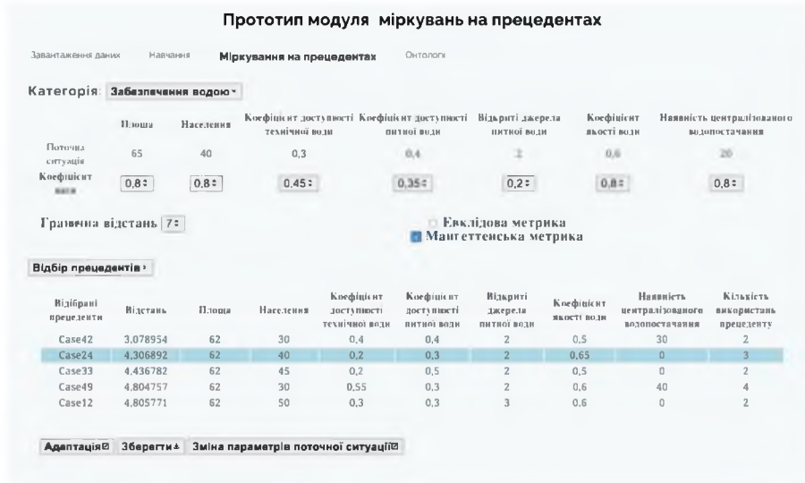
Рис. 2. Приклад використання прототипу модуля міркувань на прецедентах

прецедентах, інтерфейс якого представлено на рис. 2. Дані для проведення навчання, пов'язані з забезпеченням населення питною та технічною водою в умовах надзвичайних ситуацій, були отримані з [1] та інших відкритих джерел.