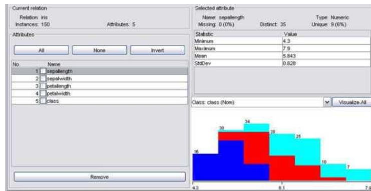
Рисунок 2 – Приклади застосування програми Weka

7. Flot. Створює анімовані візуалізації, повністю контролювати всі аспекти анімації, її відображення та взаємодії з користувачем.