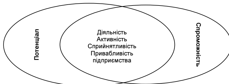
Рис. 1. Взаємне абстрактне розташування базових понять "діяльність", "активність", "привабливість", "сприйнятливість", "потенціал", "спроможність"

Враховуючи наведене вище, на рис. 1. представлено взаємозв'язок зазначених базових понять відповідно до напрямку даного наукового дослідження з метою наочного представлення отриманих результатів.