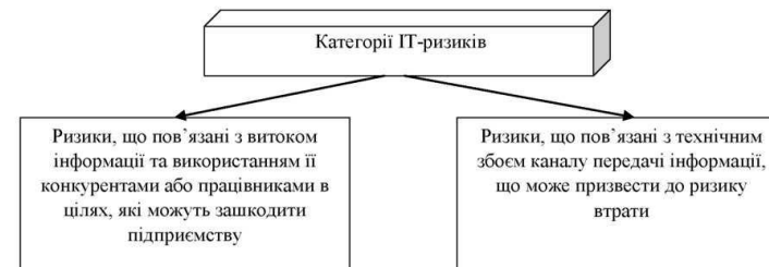
Рисунок 1 – Категорії ІТ-ризиків