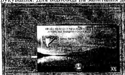
Рис.3 Приклад результату тестування

Після проходження тесту на екран монітора виводиться результат тестування (рис.3) та автоматично генерується звіт, який містить кількість правильних відповідей та оцінка. Звіт зберігається в окремому файлі, котрий автоматично відправляється на друкування. Для відповіді на запитання дається час, який встановлює викладач.