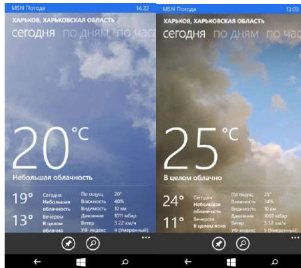
Рисунок 2 – Погодные условия: слева день первый, справа день второй

Осадков в эти дни не было. Расстояние между точками доступа было 100 метров. Ниже приведены результаты исследования в первый день уровень сигнала не превышал значения в 50%. Во второй день уровень сигнала стал выше и составил 80%. Обосновывается это более высокой влажностью.