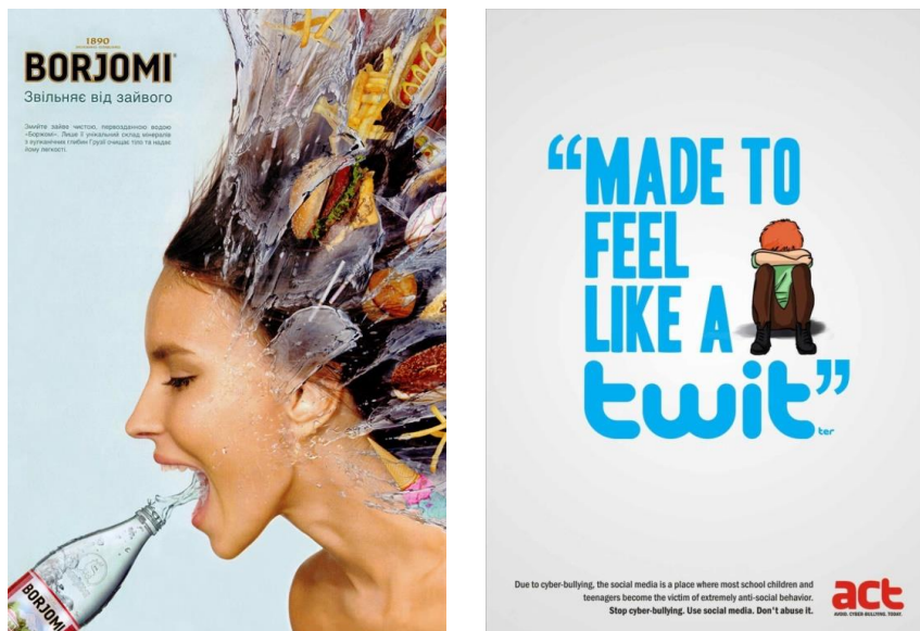
Рисунок 2 – Современный плакат

производителю больше, чем иному, который будет уступать. Качество продуктов и услуг в данном случае не играет большой роли.