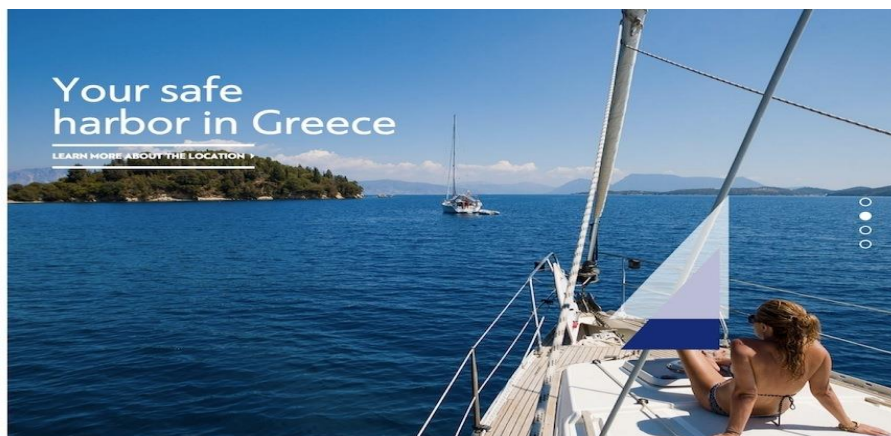
Рисунок 4 – Современный сайт

Качество типографики влияет на настроение читателей, а шрифт влияет на чувства. А это значит, что можно влиять на то, как чувствуют себя читатели. Одним шрифтом вы способны изменить их эмоциональное состояние.