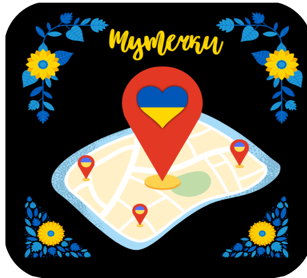
Рисунок 2 – Логотип стартапу

Для кого це корисно? Перш за все для українців, що виїхали закордон. Завдяки сервісу користувачі можуть шукати найближчі до себе торгові точки та послуги від українців за допомогою мапи. Крім українців, сервіс може бути корисним для іноземців, що підтримують українське. Це можливість ознайомитись з нашою кухнею на їх Батьківщині, придбати стильний одяг від українських майстрів або ще щось цікаве.