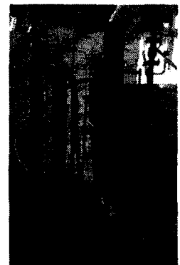
Рис. 1. Лабораторна установка НТШ

Технічні характеристики лабораторної установки представлені у табл. 1.