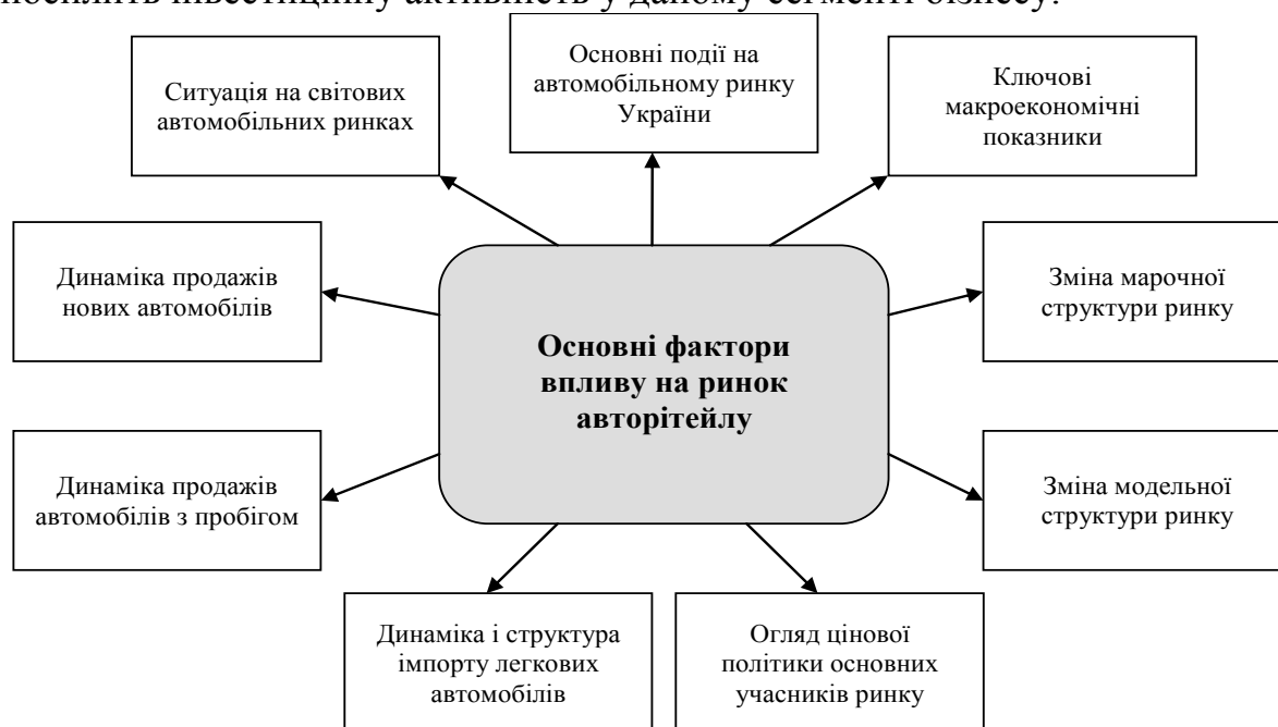
Рис. 3. Основні фактори впливу на ринок авторітейлу

Найближчим часом автомобільні дилери, швидше за все знову повернуться до стратегії експансії (відкриття нових салонів і модернізація існуючих), що посилить інвестиційну активність у даному сегменті бізнесу.