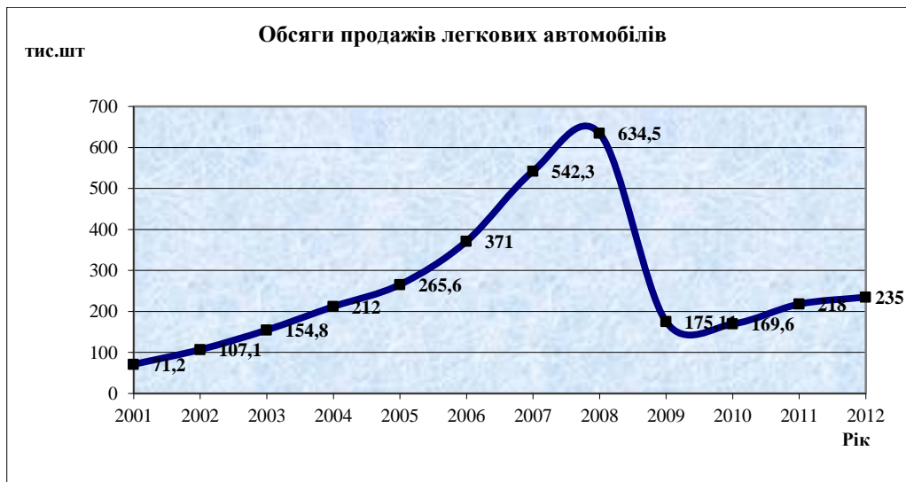
Рис. 1. Динаміка обсягів продажу нових легкових автомобілів на українському ринку

У 2010-2012 роках виробництво легкових автомобілів зростало завдяки збільшенню попиту, який знаходиться в прямій залежності від купівельної спроможності населення і зростання економіки [2]. Значна частина попиту на автомобілі на Україні задовольняється історично за рахунок внутрішнього виробництва, внаслідок чого воно сильно залежить від попиту на внутрішньому ринку. Пожвавлення попиту на легкові автомобілі на Україні підтримується за рахунок низького показника кількості автомобілів на 1000 чоловік, солідного середнього віку автомобілів, що становить близько 10 років, а також зростання індексу купівельної спроможності.