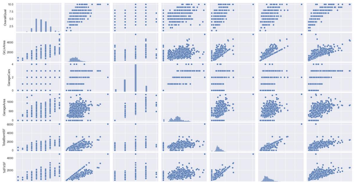
Рисунок А.2 – Приклад проміжного результату аналізу даних №2