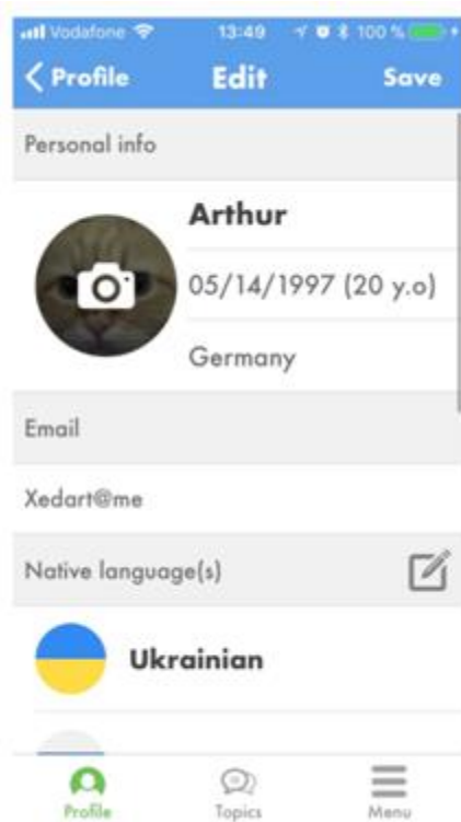
Рисунок Б.3 – Интерфейс экрана «Edit»