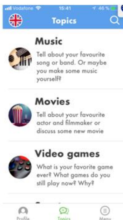
Рисунок В.2 – Приклад списку запропонованих тем