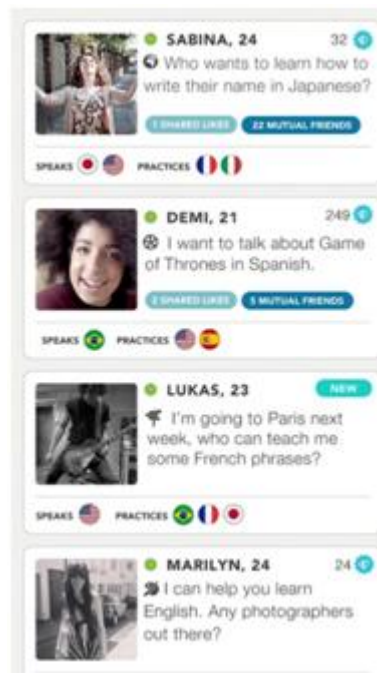
Рисунок А.1 – Интерфейс додатку «Tandem»