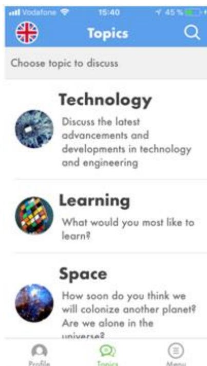
Рисунок В.1 – Приклад списку запропонованих тем