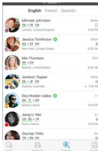
Рисунок А.2 – Интерфейс додатку «HelloTalk»