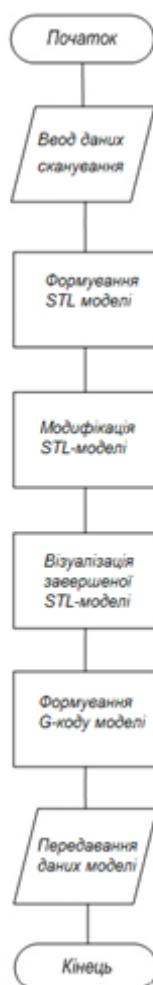
Рисунок 2 –Схема програми формування 3D моделі ортезу нижньої кінцівки в САМ-системі