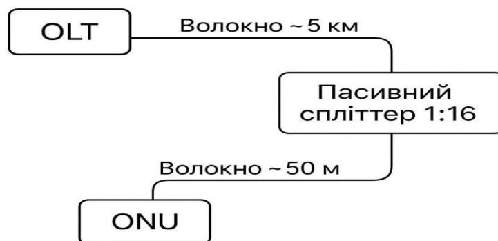
Рисунок 2.3 – Схема структури лінії Компоненти та їхні втрати:

Типова структура лінії наведено у рисунку 2.3.