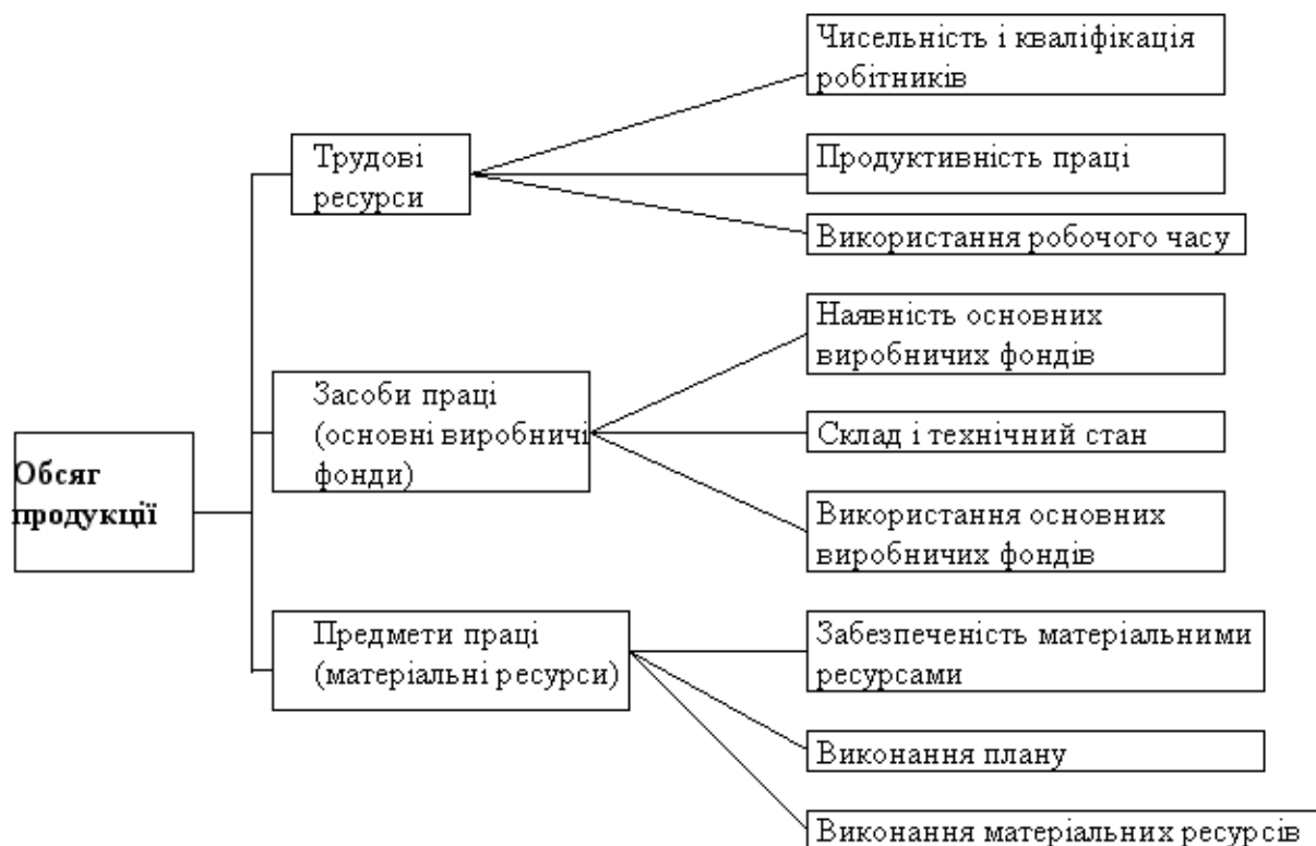
Рис. 1 - Основні групи факторів зміни обсягу продукції

Одна з найважливіших характеристик використання виробничої потужності підприємства – стабільність випуску продукції. Основні групи факторів зміни обсягу продукції наведені на рис. 1.