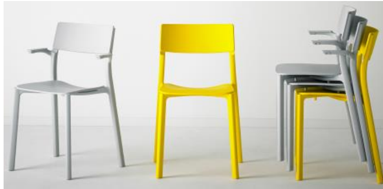
Рисунок 3 – Стулья Ikea

В школе Баухауз довольно быстро осознали важность оформления и его роль в визуальной коммуникации. Герберту Байеру была поставлена задача, создать универсальный шрифт (рис. 4). Акцент следовало сделать на разборчивости. Разрабатывая универсальный шрифт, под влиянием Пауля Рэйннера, ему удалось заменить простой и обрывистый шрифт на витиеватый и стилизованный вариант. Этот шрифт отличается асимметричным балансом элементов и отсутствием типографических засечек. Это ещё раз отражает принцип «Всё гениальное – просто».