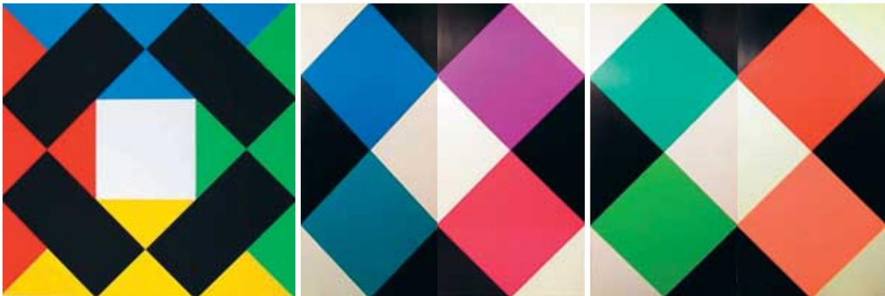
Рисунок 6 – Работы М. Билла

Таким образом, можно сделать вывод, что данное направление искусства породило немало талантливых графиков-дизайнеров. Революционное, но в то же время гармоничное для своего времени, это движение притягивало к себе все больше художников и дизайнеров, приводя к массовому созданию работ, основной чертой которых была именно простота. Идеи и принципы Баухауза остаются актуальными и по сей день.