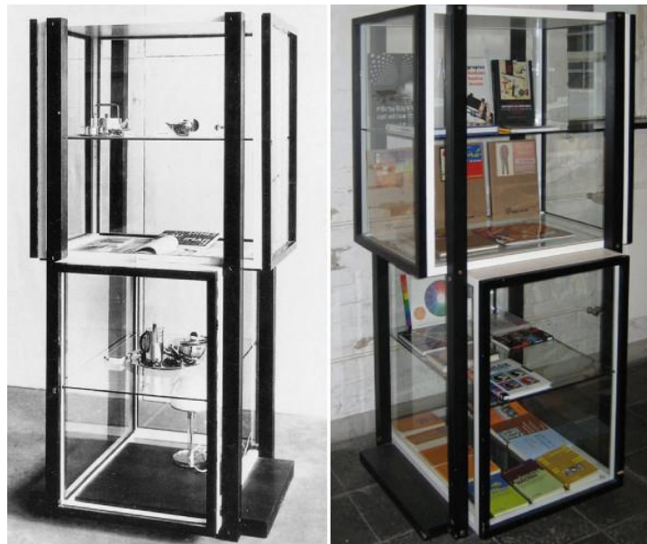
Рисунок 2 – Предметы интерьера, разработанные в школе Баухауз

Таким образом, эта школа дизайна специализировалась на изготовлении продуктов, привлекательность которых создаётся не за счёт дополнительной работы (например, внешней орнаментировки, которая требует времени на нанесение), а за счёт неотъемлемых свойств объекта (рис. 2).