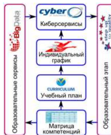
Рис. 3. Киберуправление мобильностью студента

Задачи, связанные с созданием сервиса мониторинга и индивидуального управления научно-образовательным процессом студента в рамках киберуниверситета (рис. 3):