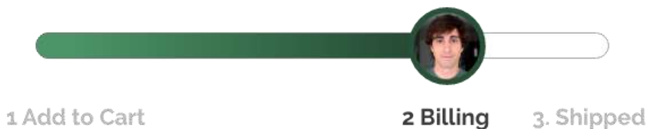
Рисунок 3 – Елементи прогрес-бару

Додайте аватарку (персональне зображення) користувача до елементів, що відображують прогрес дій користувача на сайті. Це допомагає користувачу співвіднести себе та певного актора, якій зараз діє на сайті.