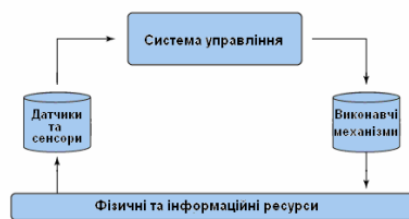
Рисунок 1. – Приклад архітектури кіберфізичної системи

Кіберфізична система (КФС) — це механізм, що контролюється або відстежується комп'ютерними алгоритмами і тісно пов'язаний з Інтернетом та його користувачами [2]. Компоненти КФС взаємодіють на різних часових та просторових рівнях та можуть мати різні, відмінні одна від одної, моделі поведінки та взаємодіяти одна з одною різними шляхами, які можуть змінюватися в залежності від контексту, на рисунку 1 наведено приклад структури кіберфізичної системи. У КФС використовується міждисциплінарний підхід, який поєднує теорію кібернетики, мехатроніку, промисловий дизайн та науковий метод. Контроль процесів часто пов'язують з вбудованими системами, в яких більше уваги приділяють обчислювальним складовим, і менше — інтенсивному прив'язуванню обчислень до фізичних об'єктів. КФС дещо схожі за архітектурою на Інтернет речей (IoT), проте вони мають більш високий рівень взаємозв'язку між фізичними та комп'ютерними компонентами.