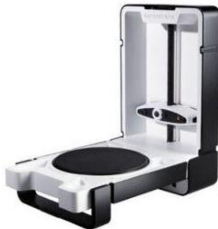
Figure 1 – A 3D Laser of the BME Department of KhNURE

Laser scanning is a highly accurate method to capture the details of any object. By using laser light, advanced scanners create 3D representations known as point clouds. These point clouds contain data that is used by the Laser Scanner and emits a beam of infrared laser light onto a rotating mirror that effectively paints the surrounding environment with light. The scanner head rotates, sweeping the laser across the object or area [1]. Laser scanning technologies for the reconstruction of objects are widely used today, including in medicine. In the simplest case, the work is reduced to registering the object's profile image [2-3]. Fig. 1 shows a 3D scanner of the BME Department of Kharkiv National University of Radio Electronics. This device we used in our experimental research for 3D scanning of biological objects.