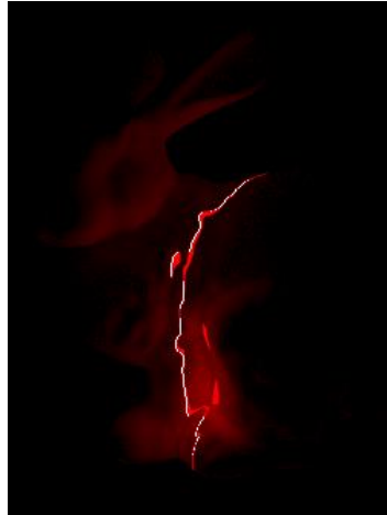
Figure 2 – A sample of profile of 3D scanning of the object

Fig. 3 represents the program module interface of 3D visualization of the scanned object, projection from the down.