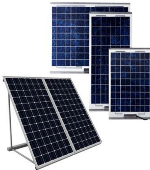
Рисунок 1 – Приклад сонячних батарей

Робота сонячної панелі полягає в тому, щоб об'єднати енергію, вироблену багатьма комітками, для створення корисної кількості електричного струму та напруги. Практично всі сучасні сонячні батареї виготовляються зі шматочків кремнію.