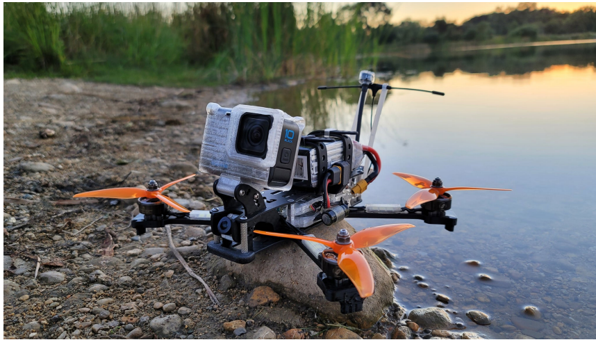
Рисунок 1 – Дрон для подорожей

4) Творчість і зйомка з іншого кута – FPV дрони відкривають нові горизонти для фотографів та кінематографістів. Вони дозволяють отримати унікальні кадри з нестандартних ракурсів, що раніше були недосяжними.