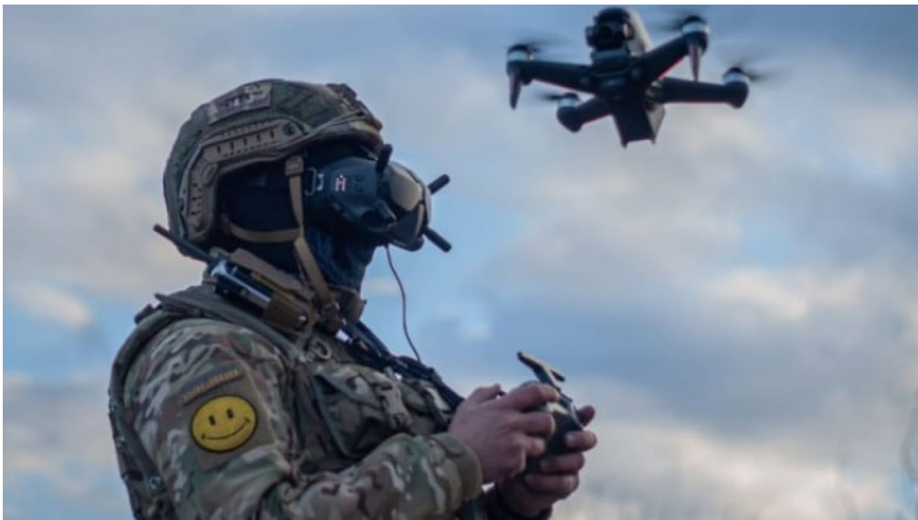
Рисунок 3 – Використання дронів у воєнних конфліктах

Використання безпілотних літальних апаратів (дронів) у воєнних конфліктах набуває все більшої актуальності, включаючи і конфлікт на сході України. Україна, як країна, що зазнає воєнних дій, також використовує повітряні дрони в армійських операціях, але варто відзначити, що використання цих технічних засобів є складною темою можна побачити на рисунку 3.