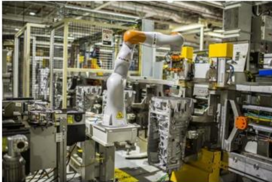
Рисунок 1 – Збиральна ділянка з роботом з підтримкою ШІ

Мічиган. В автомобільних складальних операціях, ввели у використання штучний інтелект для підтримки використання робота в певній автоматизованій складальній ролі(рис.1).