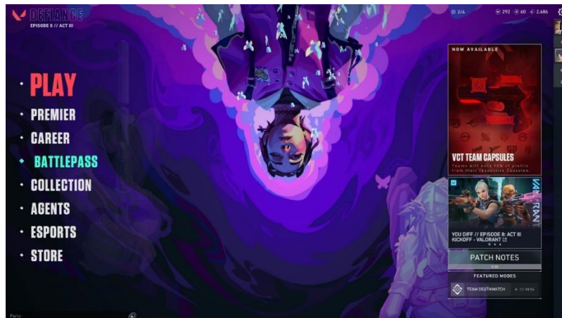
Рисунок 1 – Головний меню гри, з основними та допоміжними кольорами

створюють атмосферу, але й впливають на емоційний стан гравців і сприйняття процесу гри. За допомогою інструментів [3] було отримано кольори гри. Основні кольори, за допомогою яких легко впізнати й відрізнити її від інших – це червоний (#FE4554), чорний (#111111). Допоміжні кольори м'ятний (#42FED0) – використовується на кнопках у грі, при наведенні на кнопки у головному меню та на кнопці виборі/покупці шкінів та білий (#E4E4E4) для текстової інформації. На рисунку 1 можна побачити всю атмосферу.