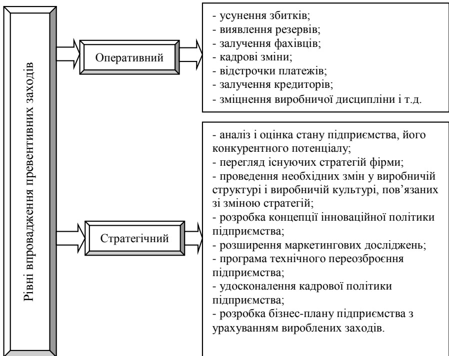
Рис. 2 – Рівні впровадження превентивних заходів запобігання банкрутства підприємства

З появою ознак настання кризової ситуації виникає потреба спрогнозувати хід її розвитку (глибину і тривалість), виконати прогноз витрат і результатів, тобто виявити доцільність і спрямованість заходів для ліквідації явних загроз безпеці існування підприємства. При ухваленні рішення щодо виходу з даної ситуації є дуже важливим спрогнозувати можливість досягнення нової мети, виконання знову встановлених стандартів і виявити ті наслідки (економічного, політичного, екологічного характеру), що очікують підприємство після виходу його з кризи. Для досягнення цілей підприємства з виходу його з кризи необхідно приймати оперативні і стратегічні заходи (рис. 2).