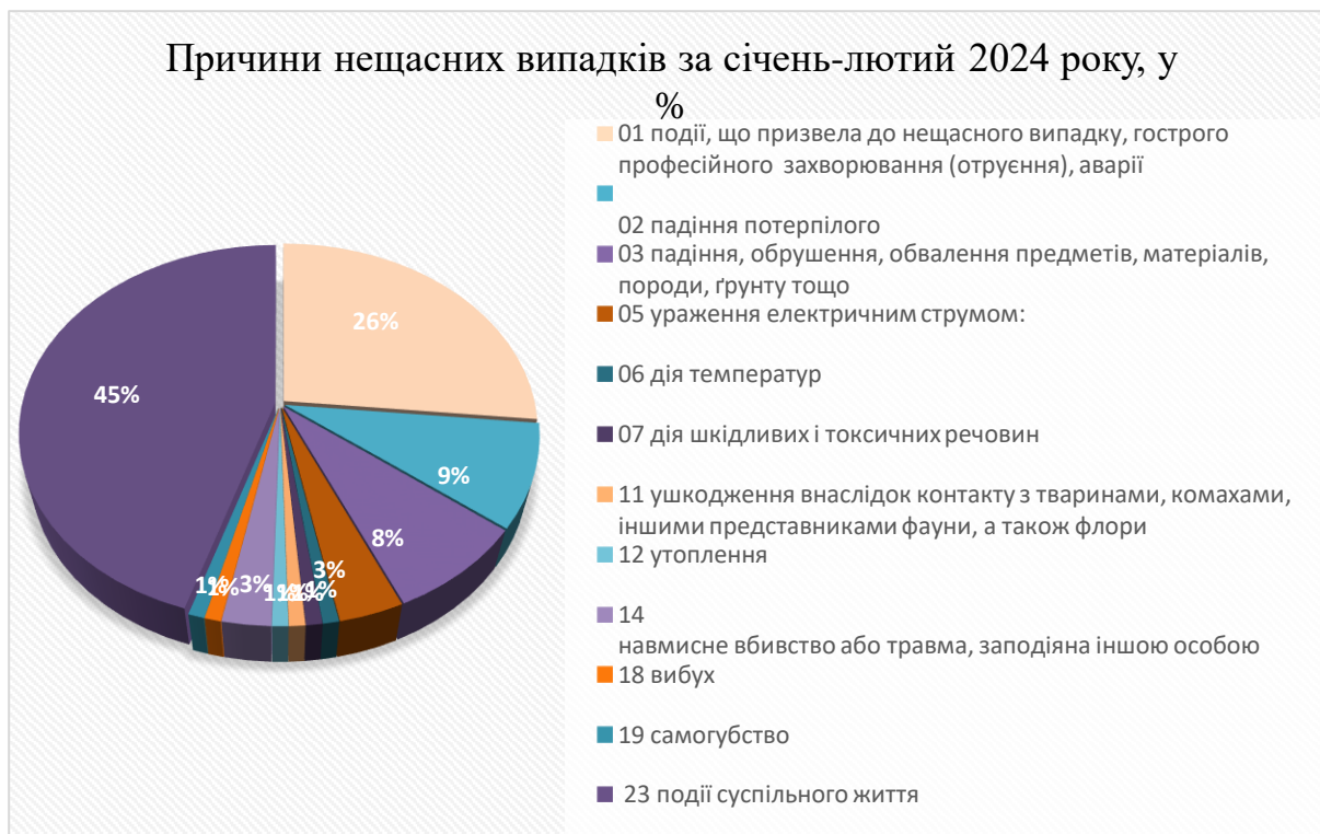
Рисунок 1 – Причини нещасних випадків

У 2023 році за перші два місяці кількість загиблих через бойові дії становила 13 осіб, тобто 18,8% від загальної кількості загиблих у відповідний період. За період січень-лютий 2022 року було виявлено 23 нещасних випадки на промисловості за кодом події 23, тобто через воєнні дії, з 23 осіб 6 загинуло, що становить 10,7% від загальної кількості загиблих у період січень-лютий 2022 року. На рис. 2 показана частка загиблих у зв'язку з бойовими діями на робочому місці у період січень-лютий за 2022-2024 роки.