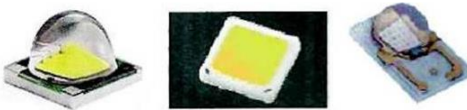
Рис. 2. – Зразки світлодіодів

5. Відсутність шуму. Світлодіодні лампи абсолютно беззвучні, що робить їх незамінним джерелом світла у виробничих приміщеннях, де сторонній звук може стати дратівливим фактором.