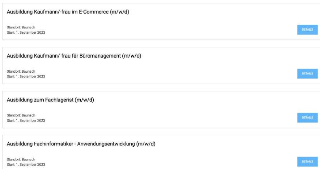
Рисунок 4.1 – Оголошення набору студентів

На момент початку роботи розділ для студентів був у розділі «Кар'єра». В самому низу даного розділу можна побачити оголошення про набір студентів (рисунок 4.1).