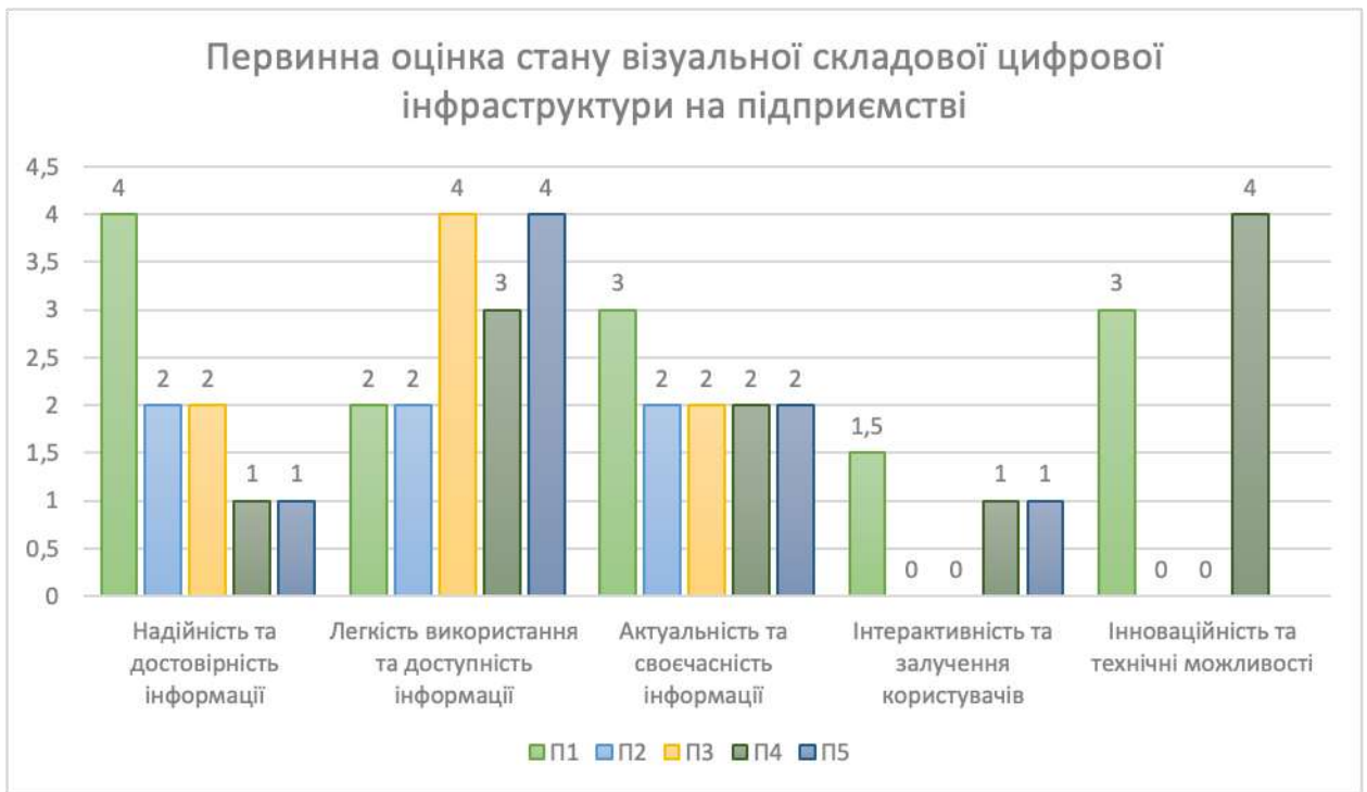
Рисунок 4.3 – Діаграма «Первинна оцінка стану візуальної складової цифрової інфраструктури на підприємстві»

П1, П2, П3, П4, П5 – це показники, за якими оцінювалися критерії. Для кожного критерію показник різний.