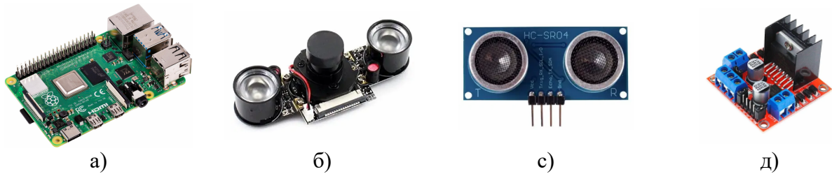
а) Raspberry Pi 4 model B (8Gb); б) Камера Waveshare RPi IR-CUT Camera; в) Ультразвуковий датчик відстані HC-SR04; г) Драйвер двигуна L298N.