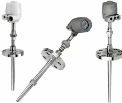
Рисунок 1 – Датчик температури SensyTemp TSP411

– датчики температури та вологості. Дані пристрої вимірюють температуру та вологість, які можуть виділяються як об'єктом автоматизації, так і середовищем, де знаходиться об'єкт. Типовим прикладом такого датчику є датчик температури SensyTemp TSP411, що зображений на рисунку 1. Зазвичай використовується для нафтогазової промисловості та має різні системи обміну даними (FOUNDATION Fieldbus, PROFIBUS PA, HART);