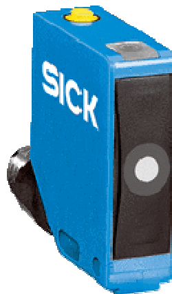
Рисунок 2 – Ультразвуковий датчик Sick UC12-11231

– датчики переміщення. Цей вид датчиків використовується для відстежування будь-якої активності на виробництві, зокрема контроль і стеження за витоком продукції, фіксація дистанції до об'єкта та інше. Зокрема, використання таких датчиків значною мірою зменшує ризик виникнення аварійних ситуацій на виробництві. Наприклад, ультразвукові датчики вимірюють відстань до керованого об'єкту або фіксують появу об'єкта у межах поля зору датчику. На рисунку 2 наведено ультразвуковий датчик Sick UC12-11231.