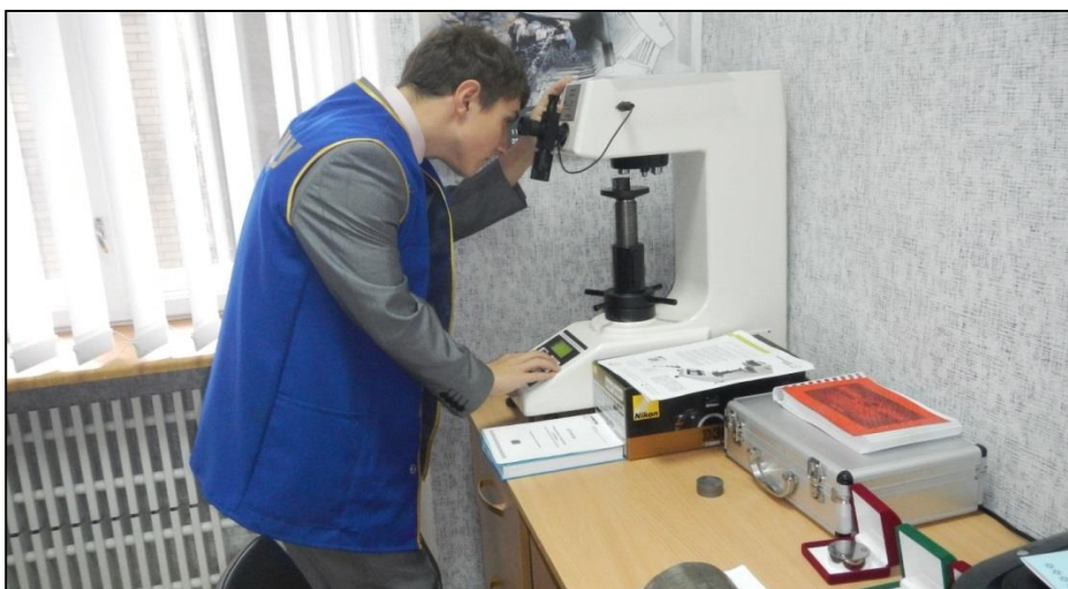
Рис. 3. Исследование образца наплавленного покрытия с помощью твердомера UIT-NV-50S

Под научно-исследовательской работой подразумевается выполнение учебных исследовательских работ, участие в конференциях, семинарах, конкурсах, выставках регионального, Всеукраинского и международного уровня. Именно в исследовательской работе реализуется развитие творческого потенциала студента. На кафедре ТМиМ большое внимание уделяется научно-исследовательской работе студентов, которая выполняется под руководством преподавателя. На кафедре имеется современное оборудование для механических испытаний материалов – разрывная машина, твердомеры, копёр, микроскопы и т.д. Студенты выполняют исследования и обрабатывают результаты - рассчитывают значения показателей механических свойств, строят графики, делают выводы (рис. 3). Результаты исследований представляют в виде докладов на конференциях и издают в виде статей.