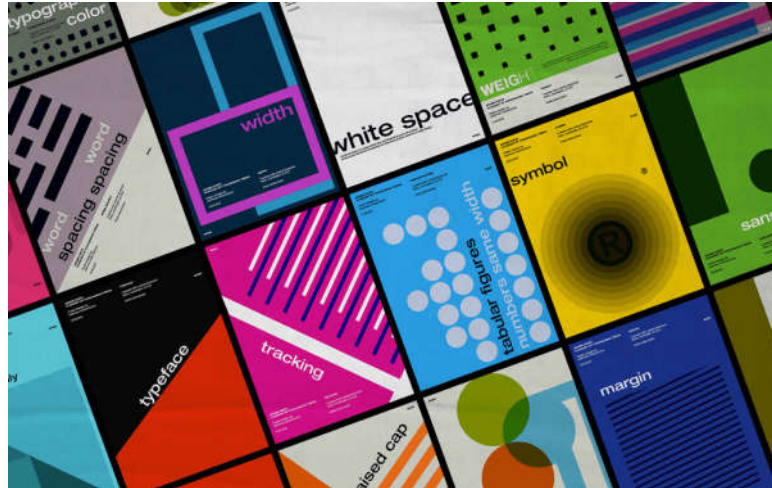
Рисунок 1 – Використання сучасних тенденцій дизайну в оформленні обкладинок

Асиметрія сітки. Робота з асиметрією повинна бути, як це не іронічно, добре прорахована. Щоб створити відчуття балансу в асиметричному дизайні, важливо переконатися, що жодна частина сторінки не є більш «важкою». Використання великих зображень ідеально балансується з текстом, простором і іншими елементами. Враховуючи різноманітність навчальної інформації (графіки, таблиці, формули, ілюстрації) асиметрія сторінок є зручною основою для створення дизайну сторінок та розворотів у цілому.