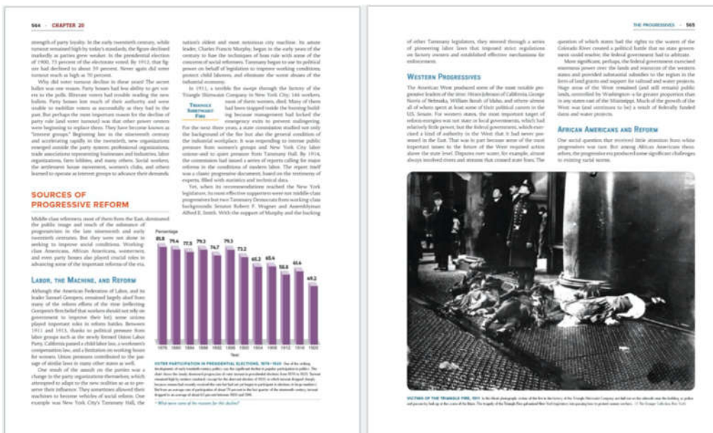
Рисунок 2 – Асиметрія у верстці підручника

Асиметрія сітки. Робота з асиметрією повинна бути, як це не іронічно, добре прорахована. Щоб створити відчуття балансу в асиметричному дизайні, важливо переконатися, що жодна частина сторінки не є більш «важкою». Використання великих зображень ідеально балансується з текстом, простором і іншими елементами. Враховуючи різноманітність навчальної інформації (графіки, таблиці, формули, ілюстрації) асиметрія сторінок є зручною основою для створення дизайну сторінок та розворотів у цілому.