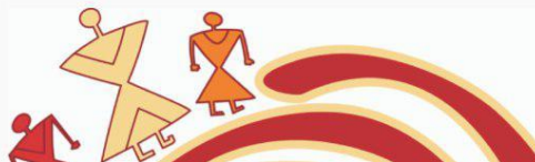
Рисунок А.2 – Приклад зміни шрифту

Запрошуємо усіх, хто поділяє нашу мету і принципи роботи, підтримати Фонд. Разом ми можемо зробити більше!