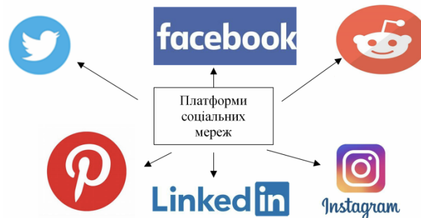
Рисунок 3 – Платформи соціальних мереж

Тож, основними викликами при пошуку інформації в Інтернет є виявлення правдивої інформації серед величезних потоків даних, перевірка її достовірності та протидія цілеспрямованому розповсюдженню фейків.