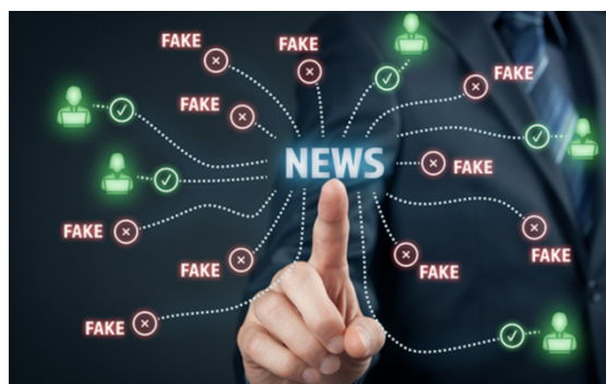
Рисунок 2 – «Фейкові новини»

При пошуку інформації в Інтернеті в останні роки набуло значного поширення явище дезінформації чи «фейкових новин» (рис. 2).