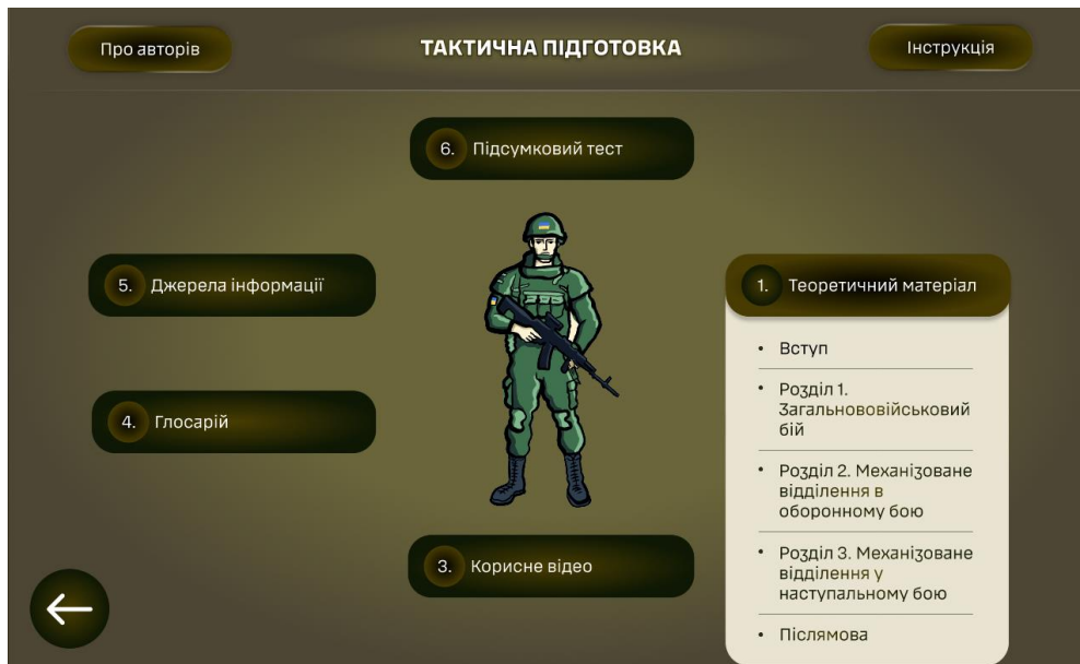
Рисунок 2 – Головний екран з розгорнутим меню теоретичного матеріалу

На сторінках (екранах) розділів у логічній послідовності збалансовано поєднана текстова, графічна (jpg) та відео (mp4)-тематична інформація (рис. 3).