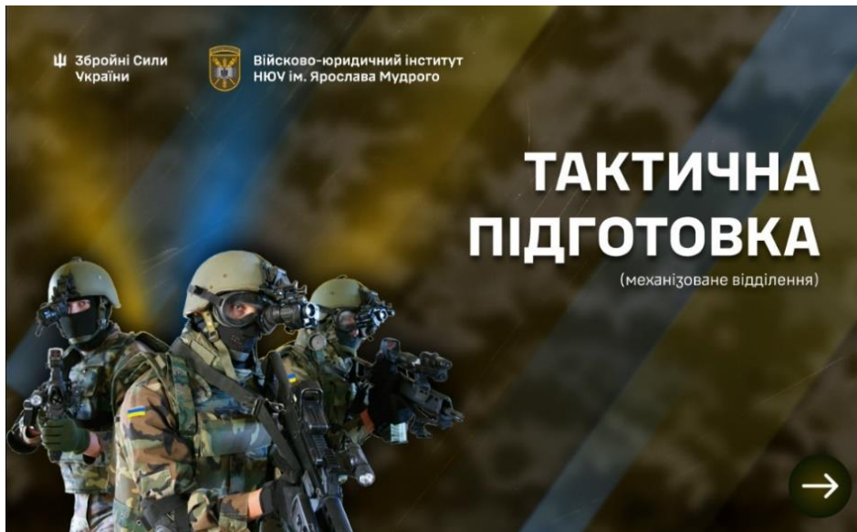
Рисунок 1 – Головний екран

Для забезпечення вимог замовника, цілісності інтерфейсу, привернення уваги користувача та просування бренду Збройних Сил України в інформаційній структурі видання передбачено обкладинку (рис. 1).