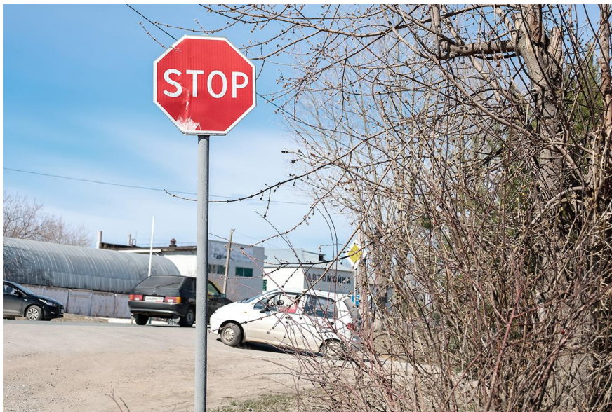
Рисунок А.9 – Результати комбінованого аналізу (об'єкти та текст) на зображенні (набір C_both), приклад 3