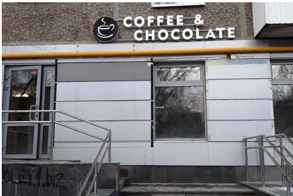
Рисунок А.5 – Результаты OCR-анализу на изображении (набір В_осг), приклад 2