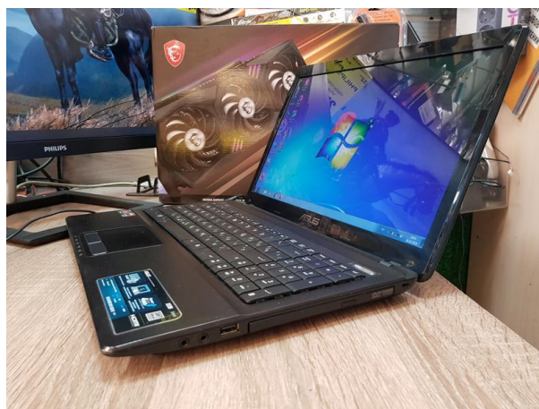
Рисунок А.1 – Результати детекції об'єктів на зображенні (набір A_objects), приклад 1

Вхідні дані експериментів з використанням мультимодальної моделі Qwen-VL для задач детекції об'єктів, оптичного розпізнавання тексту та їх комбінованого аналізу