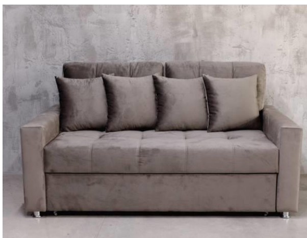
Рисунок А.2 – Результати детекції об'єктів на зображенні (набір A_objects), приклад 2