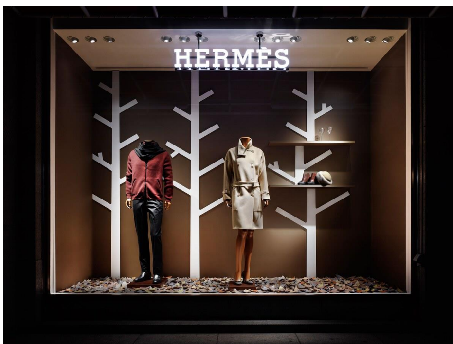
Рисунок А.8 – Результати комбінованого аналізу (об’єкти та текст) на зображенні (набір С_both), приклад 2