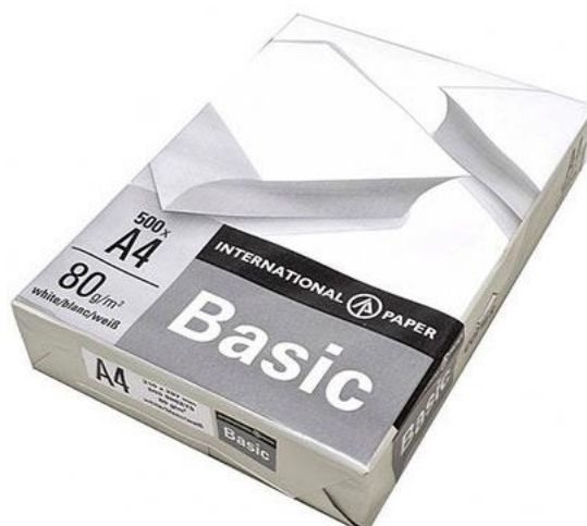
Рисунок А.7 – Результати комбінованого аналізу (об’єкти та текст) на зображенні (набір С_both), приклад 1