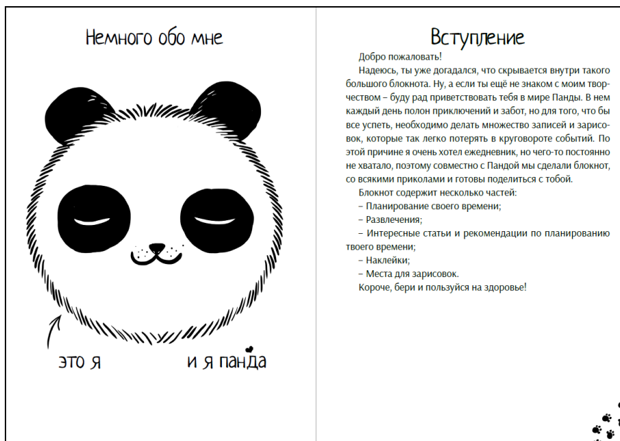
Рисунок 2 – Креативное приветствие читателя на первых страницах ежедневника

Все это может быть достигнуто с помощью специальных вставок (рисунок 3), таких как: разнообразные стикеры, рисунки внутри ежедневника, индивидуальные обложки и др.