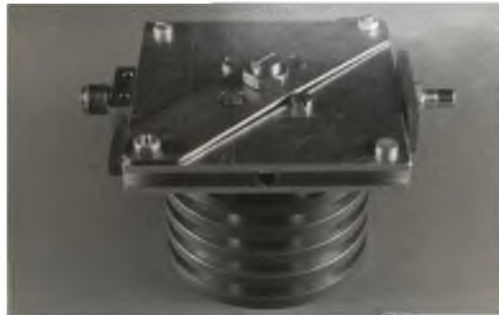
Рис. 2. Зовнішній вигляд ГЛПД

Ескіз конструкції варіанту генератора на лавинно-пролітному діоді, параметри якого були досліджені, наведено на рис.2