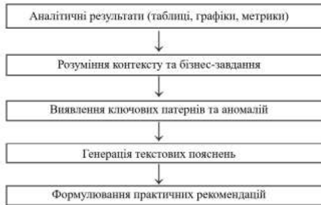
Рисунок 3 – Процес інтерпретації аналітичних результатів за допомогою LLM

LLM вносять значний вклад у найбільш важливий етап аналітичного процесу – інтерпретацію результатів та генерацію практичних рекомендацій. Процес інтерпретації аналітичних результатів за допомогою LLM наведено на рисю. 3.