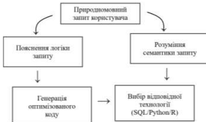
Рисунок 2 – Цикл обробки запитів за допомогою LLM

Однією з найпотужніших можливостей LLM є здатність перетворювати природномовні запити на робочий аналітичний код. Цикл обробки запитів за допомогою LLM наведено на рис. 2.