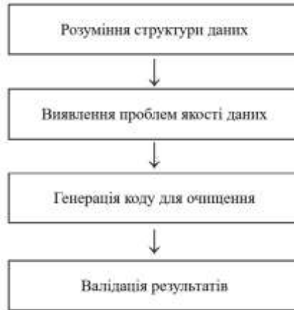
Рисунок 1 – Концепція використання LLM

Після ідентифікації проблем LLM генерують відповідний код для очищення даних, використовуючи популярні бібліотеки, такі як pandas, dplyr або SQL, залежно від технологічного стеку користувача.