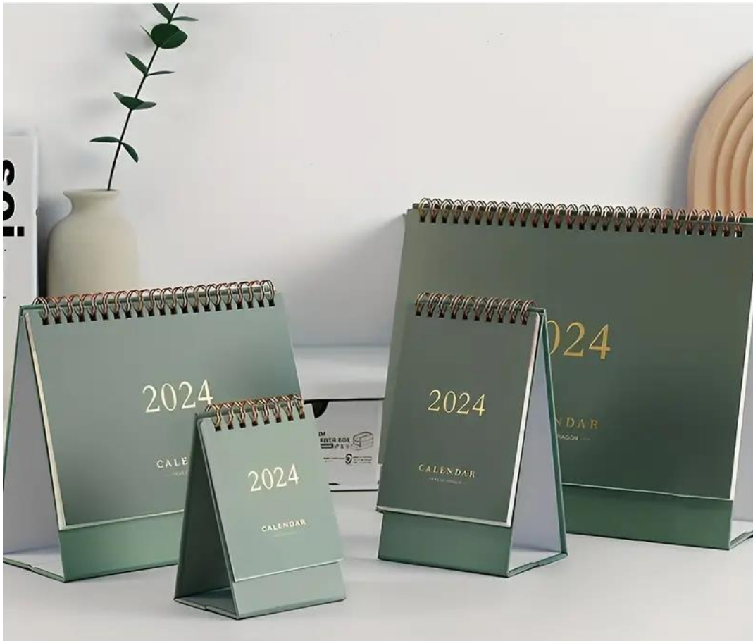
Рисунок 2 – Приклади календарів з перекидними сторінками

Приклади таких календарів представлено на рисунку 2.