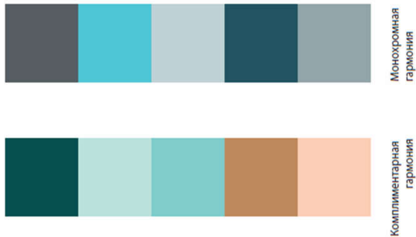
Рисунок 1 – Підбір колірних схем

за допомогою ресурсу Adobe Color. За суб'єктивним висновком, для акцентних кольорів найкраще підходить комплементарна та монохроматична гармонії.